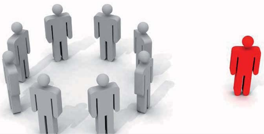
Mobbing bei Arbeitnehmern betrifft auch den Arbeitgeber.

In einem daraufhin im November stattfindenden Gespräch zwischen dem Arbeitnehmer, dem Verwaltungsleiter und den Kollegen des Arbeitnehmers konnten die Differenzen nicht ausgeräumt werden, so dass vom Verwaltungsleiter die Hinzuziehung eines Mediators erwogen wurde. Weitere Schritte wurden nicht gesetzt.