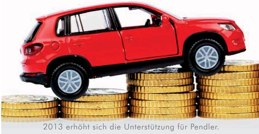
2013 erhöht sich die Unterstützung für Pendler.