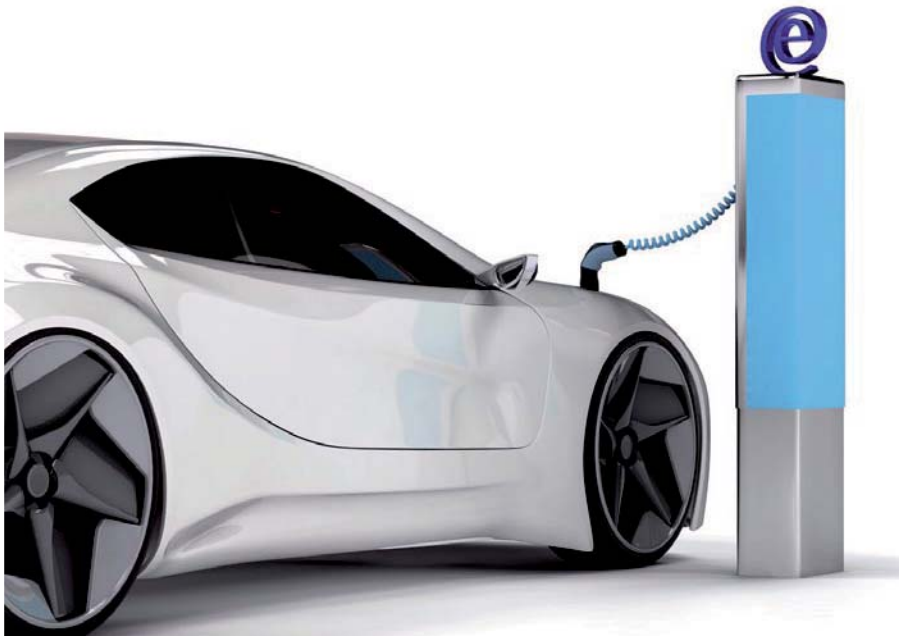
E-Autos sind auch steuerlich interessant